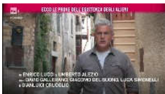
Enrico LUCCI conduttore

Lo scorso giovedì 26 ottobre 2017 sul secondo canale televisivo della RAI è andata in onda una delle più mortificanti dimostrazioni di come il servizio televisivo pubblico spesso sprechi i soldi degli abbonati...Ci riferiamo alla puntata di "NEMO-nessuno escluso" condotto da Enrico LUCCI (ex inviato della trasmissione "Le Iene") durante la quale sono state mandate in onda una serie di interviste realizzate durante il Convegno Ufologico di Savona dello scorso 16 settembre ma anche "avanzi" delle interviste fatte al Convegno semestrale di Pomezia del maggio 2017.