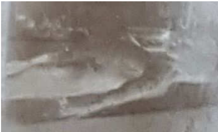
un frame del presunto vero filmato dell'autopsia aliena?

A noi non resta altro che attendere nuove e più convincenti analisi scientifiche sulle immagini in questione da parte di gruppi di studio più seri e più preparati.