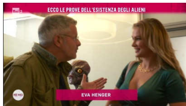
Eva Henger (pornostar)

Al netto delle validità scientifica di alcune relazioni e dell'opportunità o meno della presenza di taluni ospiti della kermesse ufologica ligure (come la pornostar Eva Henger), non si può comunque non contestare la maniera nella quale le varie interviste sono state realizzate e, soprattutto,