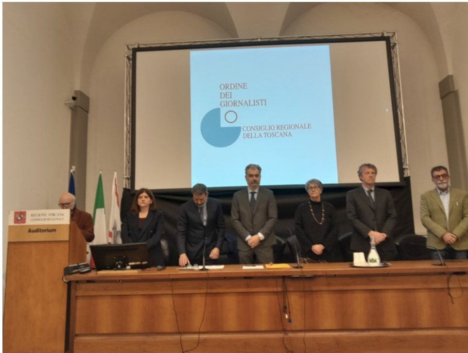
Un momento della cerimonia